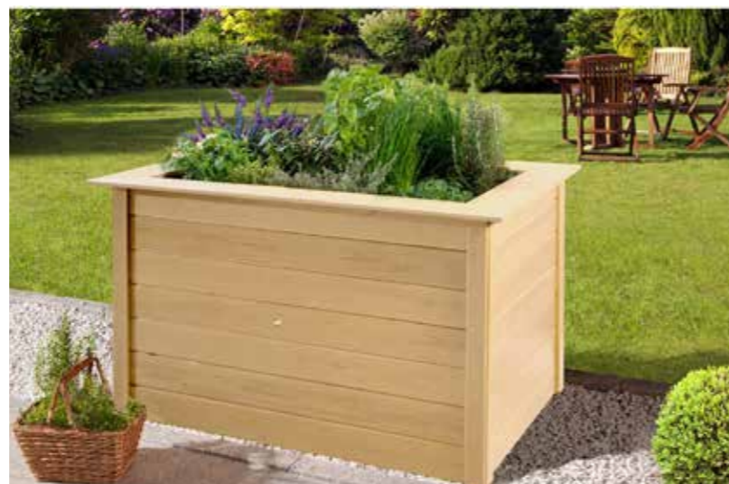
Gärtnern auf dem Podest: Nicht nur Gemüse und Kräuter, auch Zierpflanzen fühlen sich in einem Hochbeet sehr wohl.

Ein feinmaschiges Drahtgitter schützt das Hochbeet vor Mäusen, eine Noppenfolie vor Feuchtigkeit. Die unterste Schicht setzt sich aus groben Zweigen, Ästen und Häckselgut zusammen, gefolgt von einer Schicht Laub. Darauf verteilt man Naturkompost aus dem Garten oder von OBI. Je nachdem, was angepflanzt wird, besteht die oberste Schicht aus