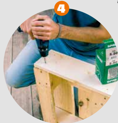
4 Verschrauben Armlernen und Kanthölzer an die zuvor abgesägten Fussteile schrauben.