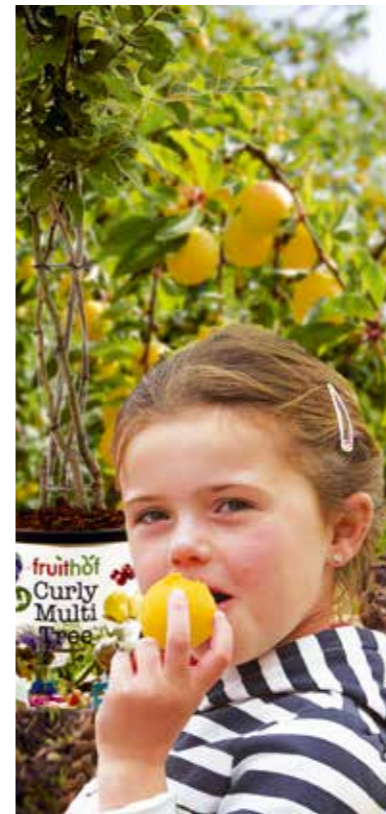
Früchte vom eigenen Mini-Obstbaum: So macht Pflaumen essen besonders Spass.

Mini-Obstbäume liefern knackiges Obst und brauchen wenig Platz.