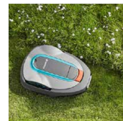
GARDENA SILENO city heisst das Wunderding für eine perfekte und mühelose Rasenpflege.