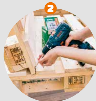
2 Rückenlehne Die Rückenlehne wie in der Abbildung an die Sitzfläche schrauben.