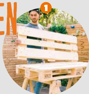
1 Sägen Palette wie in der Abbildung zusägen.