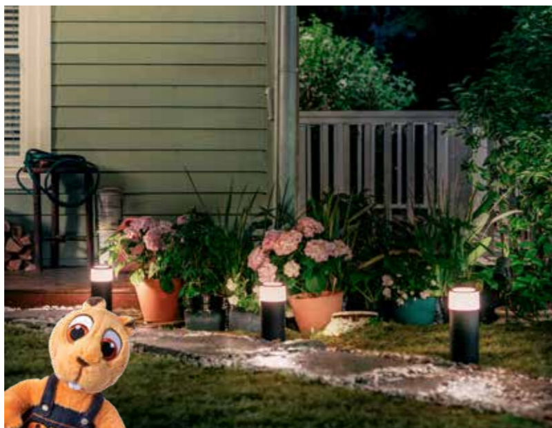
Mit einer perfekten Aussenbeleuchtung geniesst man die Schönheiten des Gartens auch nach dem Sonnenuntergang.

Für die Begrüssung an der Haustür, den Grillabend auf dem Balkon oder eine Party im Garten – die Aussenleuchten von Philips produzieren für jeden Anlass das richtige Licht und die passende Stimmung.