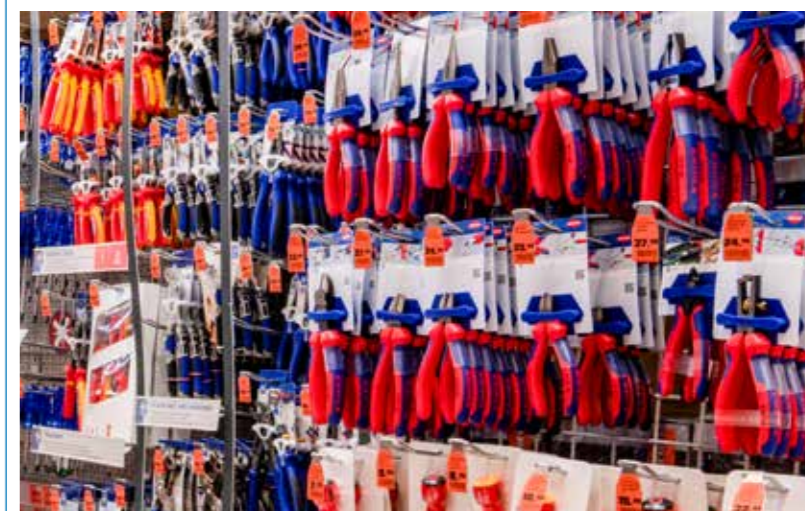
OBI führt nur Qualitätswerkzeuge von renommierten Herstellern wie LUX , Proxxon , Knipex und PB Swisstools .

Verlässliche Handwerkzeuge sind die Basis jeder sauberen Arbeit.