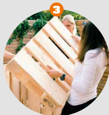
3 Beine Palette wie in der Abbildung zusägen. Eine Palette ergibt zwei Beinteile.