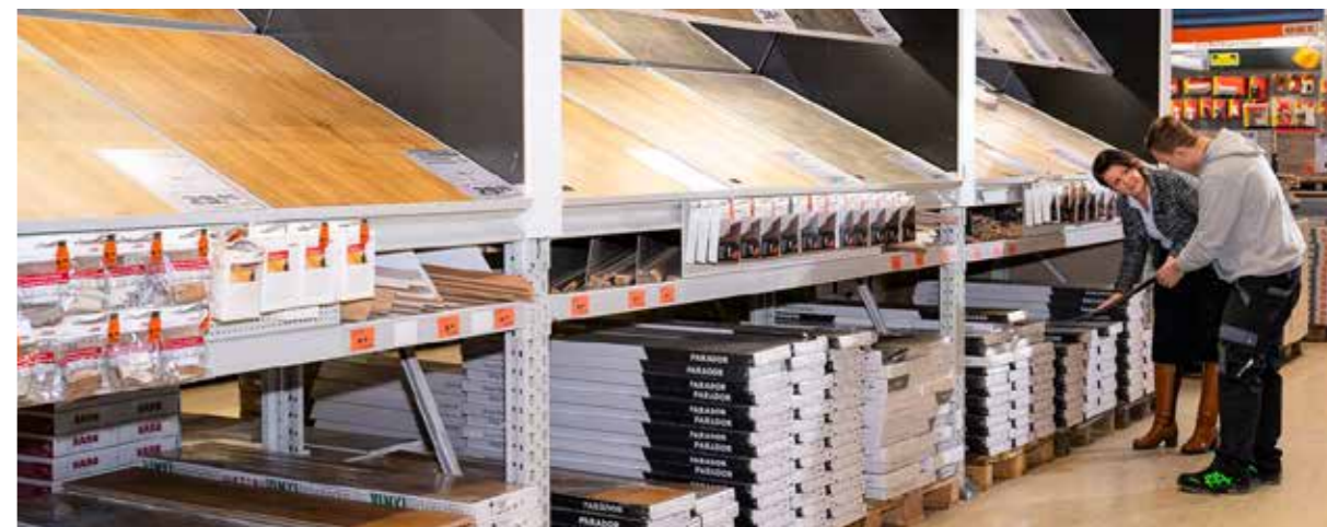
Parkett, Laminat, Vinyl oder Kork? Wer einen Bodenbelag sucht, kann im OBI aus dem Vollen schöpfen.

Auch der Vinyldesignboden Mineral Pro hält härtesten Beanspruchungen stand. Er ist ideal für Wohnräume und den gewerblichen Bereich und lässt sich dank Klicksystem einfach schwimmend verlegen.