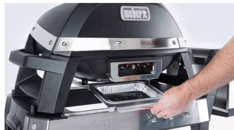
Mit dem Weber Pulse grilliert man unkompliziert – und sauber.

Der Elektrogrill Weber Pulse gart das Fleisch genau auf den Punkt.