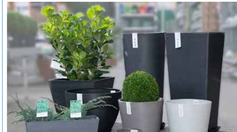
ECOPOTS in diversen Farben und Formen verschönern Haus und Garten.

Früher waren sie PET-Flaschen, jetzt sind sie schöne Blumentöpfe.